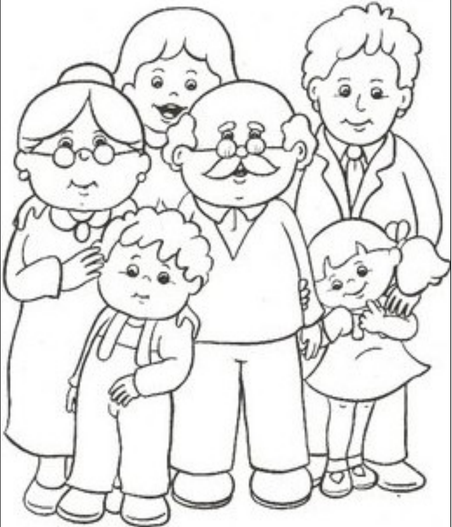
Mother-Father-Grand Mother-Grand Father-Brother-Sister